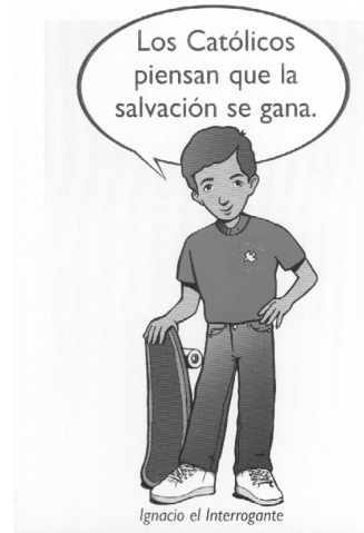
Ignacio el Interrogante