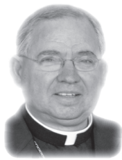
ARCHBISHOP JOSÉ H. GOMEZ

El Arzobispo DiNardo será creado Cardenal de la Iglesia en